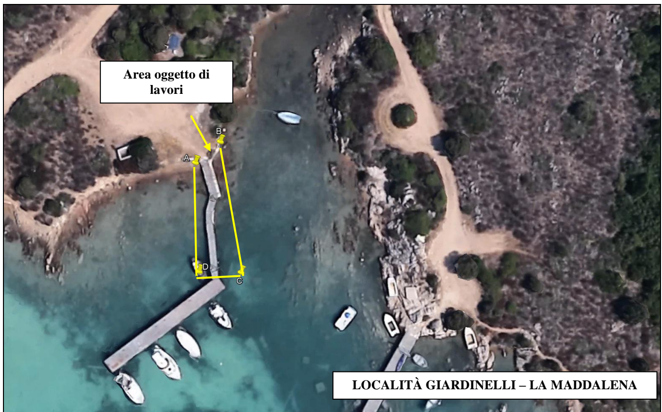
Tabella – Lavori posizionamento pontile in località Giardinelli – La Maddalena (SS)